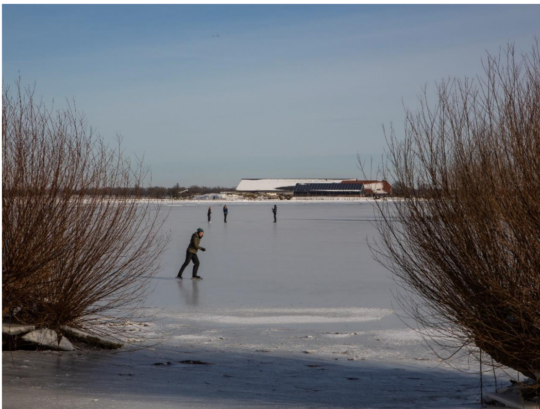
In de Fraterwaard nemen in februari schaatsers de plaats in van de ganzen

Overzicht van de aantallen getelde ganzen per soort vergeleken met vijf vorige seizoenen